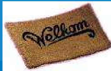
1. Nieuwe openingen