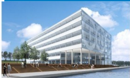
Het meest duurzame kantoorgebouw van Nederland